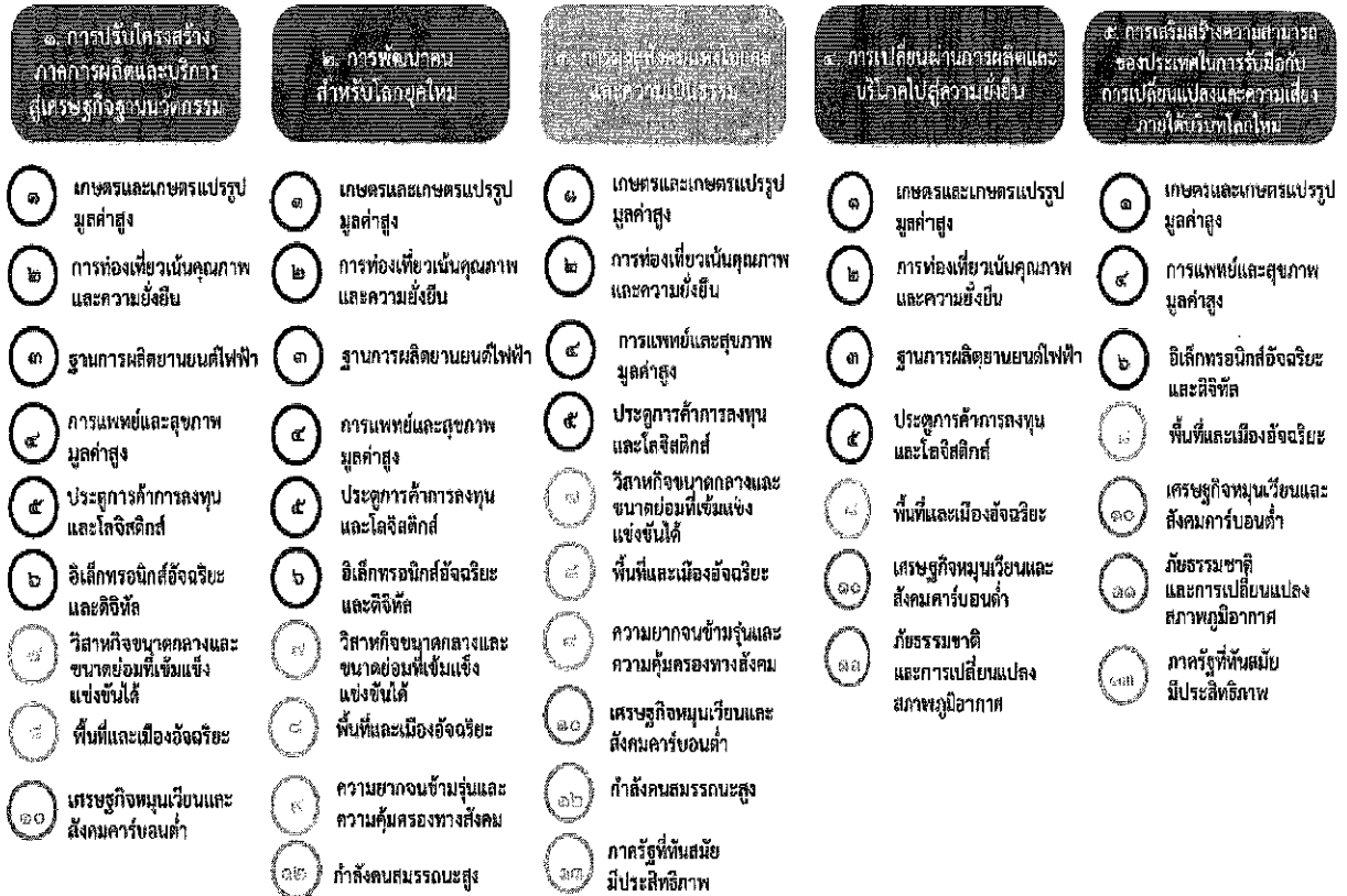
แผนภาพที่ ๓.๑ ความเชื่อมโยงระหว่างหมวดหมู่การพัฒนา กับเป้าหมายหลัก

ความเชื่อมโยงระหว่างหมวดหมู่การพัฒนา กับเป้าหมายหลักแสดงไว้ในแผนภาพที่ ๓.๑ โดยหมวดหมู่การพัฒนาที่กำหนดขึ้นเป็นประเด็นที่มีลักษณะเชิงบูรณาการที่ครอบคลุมการพัฒนาตั้งแต่ในระดับต้นน้ำจนถึงปลายน้ำ และสามารถนำไปสู่ผลพัฒนาทั้งในมิติเศรษฐกิจ สังคม ทรัพยากรธรรมชาติและสิ่งแวดล้อมไปพร้อมๆ กัน ทำให้หมวดหมู่แต่ละประการสามารถสนับสนุนเป้าหมายหลักได้มากกว่าหนึ่งข้อ นอกจากนี้การพัฒนาภายใต้แต่ละหมวดหมู่ไม่ได้แยกขาดจากกัน แต่มีการสนับสนุนหรือเอื้อประโยชน์ซึ่งกันและกัน