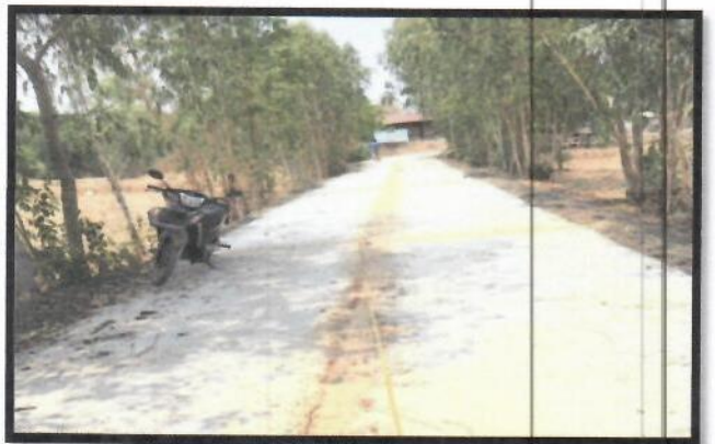
๑๖.โครงการก่อสร้างถนนคอนกรีตเสริมเหล็กสายบ้าน (นายทองใบ กองศิริ) ม.๕ งบประมาณในการดำเนินโครงการ ๑๐๐,๐๐๐ บาท