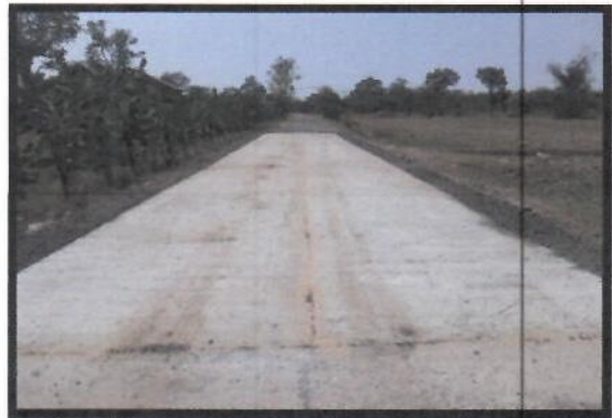
๑๔.โครงการก่อสร้างถนนคอนกรีตเสริมเหล็กรอบหมู่บ้าน (นายสุภาพ พระงาม) ม.๑ งบประมาณในการดำเนินโครงการ ๑๔๓,๐๐๐ บาท