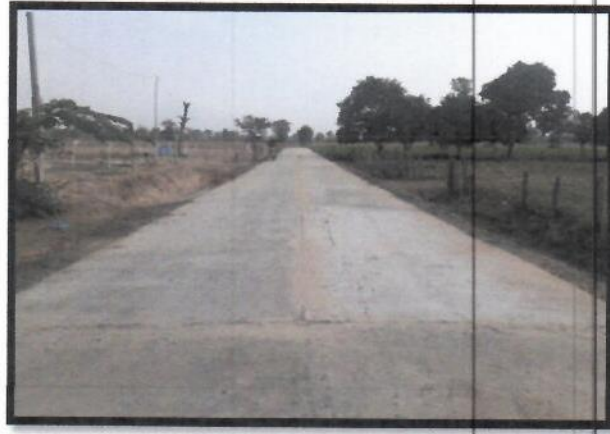
๑๘.โครงการก่อสร้างถนนคอนกรีตเสริมเหล็กสายบ้าน (นายเชียร แสนสุข) ม.๓ งบประมาณในการดำเนินโครงการ ๑๓๐,๐๐๐ บาท