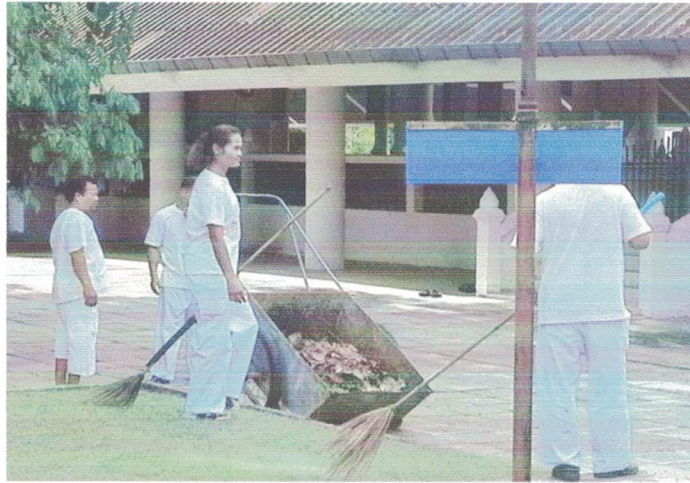
ทำความสะอาดบริเวณวัด / ห้องน้ำ