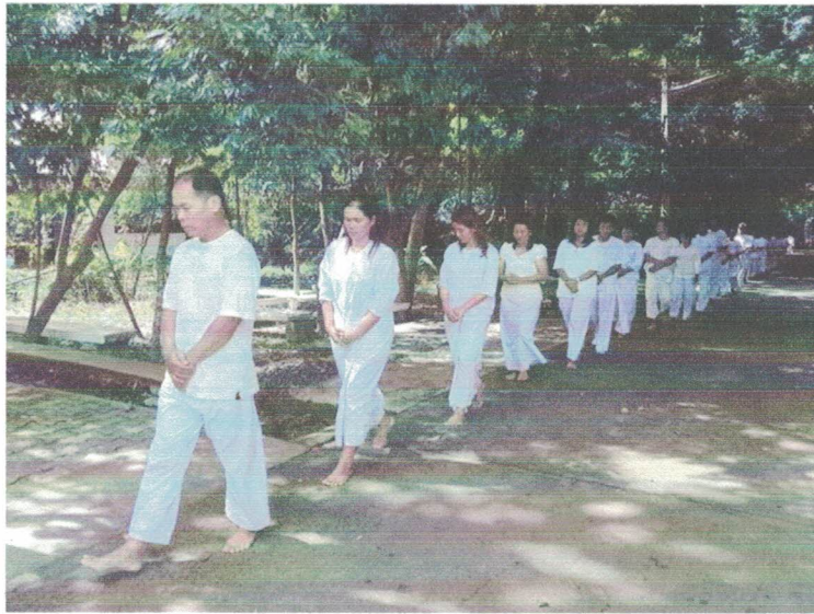
เดินจงกรม