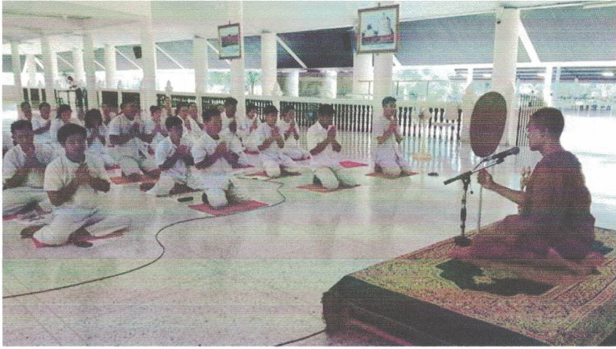
สวดมนต์ไหว้พระ